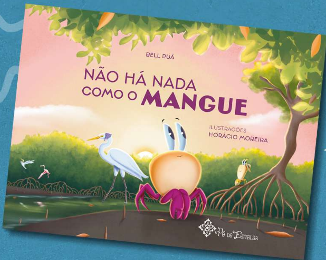
Não há nada como o Mangue (Pó de Estrelas, 2025)