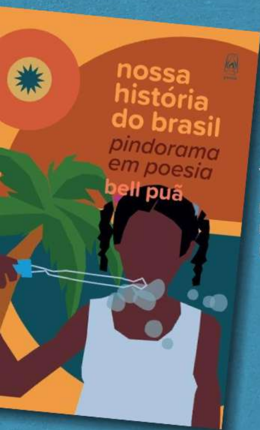
Nossa História do Brasil: Pindorama em poesia (Litteralux, 2024)