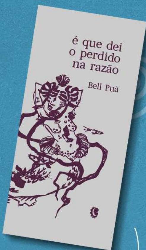
É que dei o perdido na razão (Castanha Mecânica, 2018)

A artista tem cinco livros autorais publicados, listados abaixo, além de participação em diversas antologias. Participou de inúmeras feiras e festivais literários como FLIP – 2018 e 2024, II FELIS – Feira Literária do Sertão (2018), 29º FIG (2019); Festa de Louro do Pajeú (2020 e 2025); 10ª Bienal Internacional do Livro de Alagoas (2023); FOLIO – Festival Literário Internacional de Óbidos, em Portugal (2023); FLIM – Maringá (2024); FLUP – Rio de Janeiro (2024); XV Bienal Internacional do Livro de PE (2025); FLIPORTO (2025).