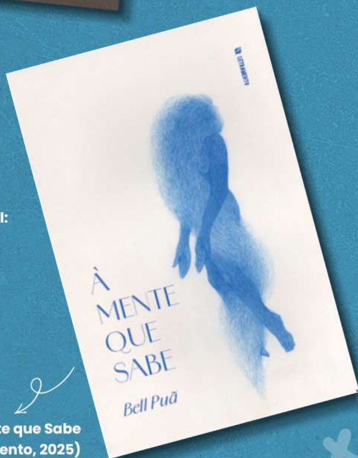
À Mente que Sabe (Letramento, 2025)