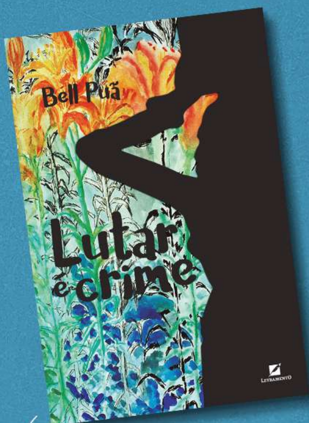
Lutar é Crime (Letramento, 2019) Finalista Prêmio Jabuti 2020